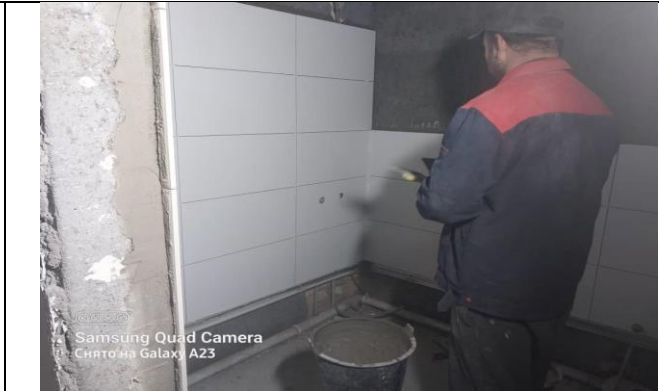
Фото 2: Укладка плитки, январь 2024 года