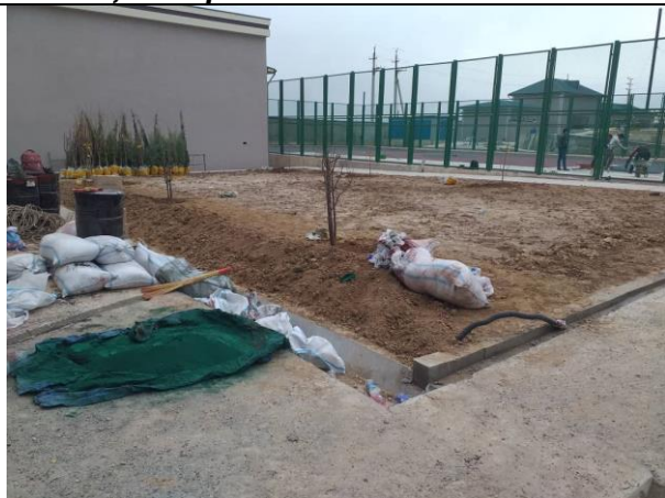
Фото 7: Ландшафтный дизайн территории, март 2024 г.