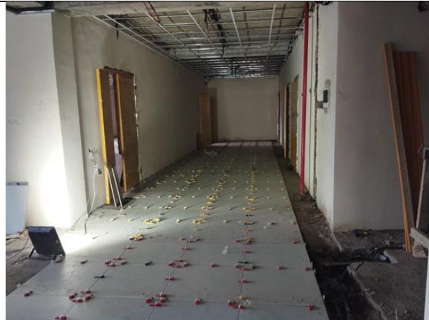
Фото 4: Укладка стяжки пола на всех уровнях учебного корпуса, май 2024 г.