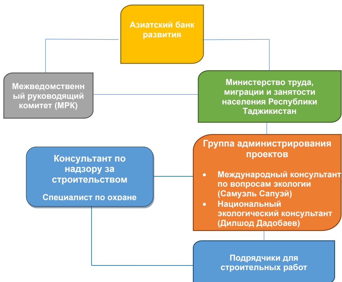
Рисунок 2. Организационная структура проекта и экологическая группа

37. Организационная структура проекта и команда специалистов по охране окружающей среды представлены на рисунке 2 ниже.