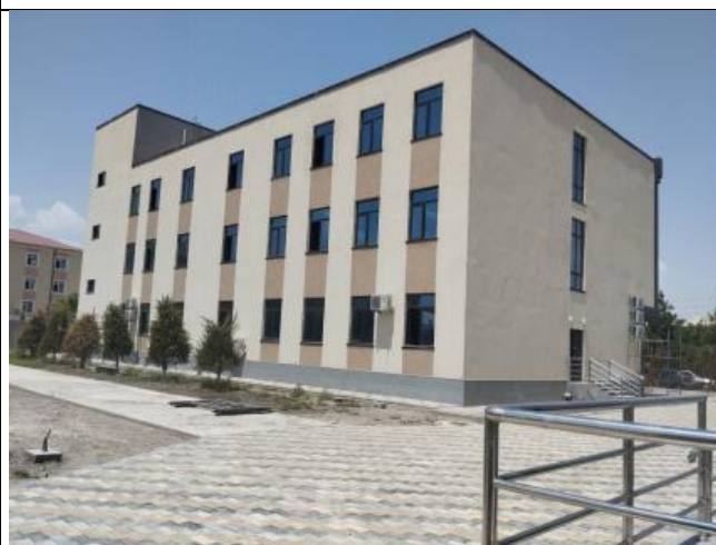
Фото 12: Окрашенный фасад, июнь 2024 года