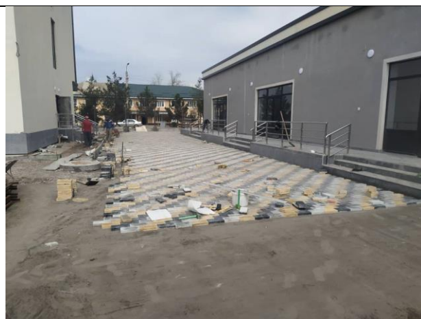
Фото 10: Укладка брусчатки, март 2024