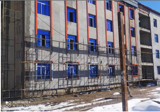
Фото 1: Строительство фасада здания, февраль 2024 г.