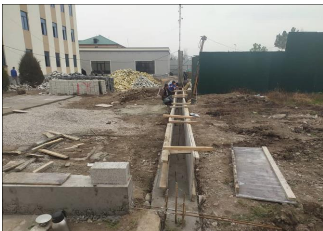
Фото 9: Бетонирование лотка, февраль 2023 г.