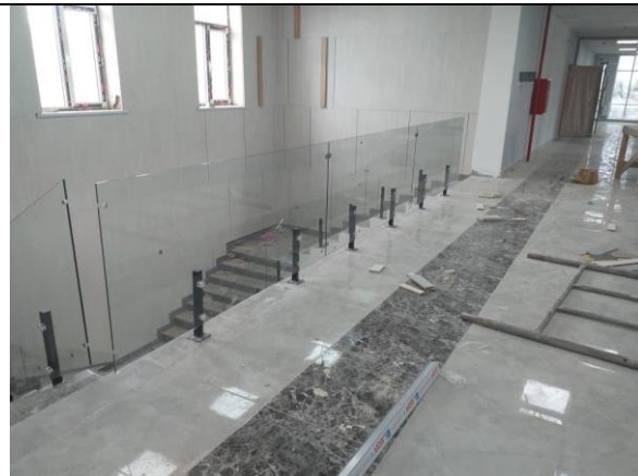
Фото 8: Установка лестничных перил, май 2024 года