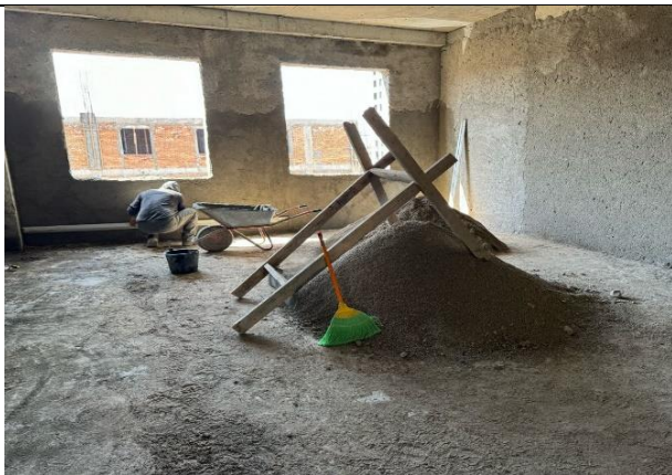
Фото 13: Штукатурные работы, апрель 2024 года