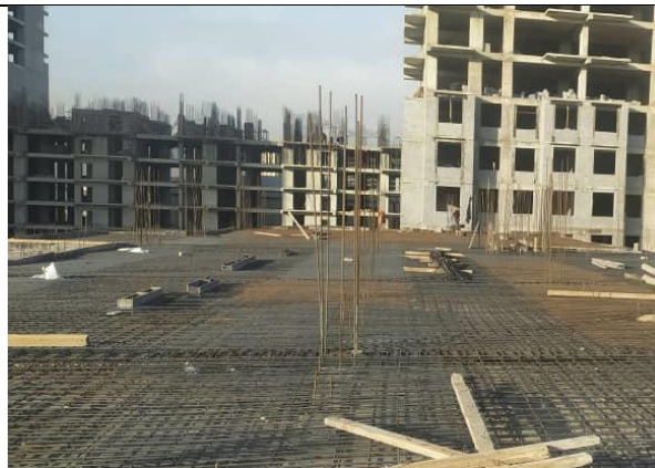
Фото 14: Укрепление пола, апрель 2024 г.