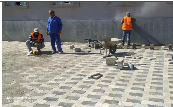
Фото 18: CW05/2 Рабочие надевают СИЗ, март 2024 г.