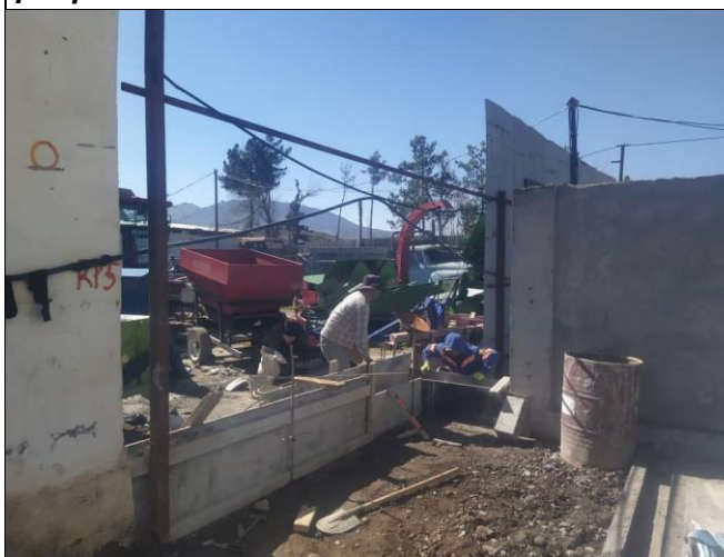
Фото 11: Строительство ограждающей стены, май 2024 года