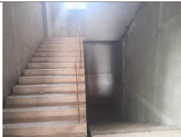
Фото 16: Строительство посадочной площадки, июнь 2024 года