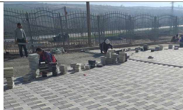
Фото 17: CW05/2: Рабочий не надел СИЗ и комбинезон, март 2024 г.

49. За отчетный период было проведено множество посещений объектов. В целом, соблюдение экологических норм и правил безопасности признано удовлетворительным; тем не менее, были отмечены случаи, когда рабочие не использовали средства индивидуальной защиты (СИЗ). После устного предупреждения эти несоответствия были оперативно устранены.