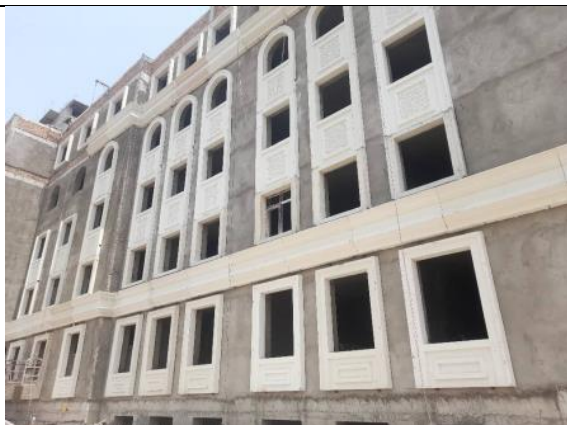
Фото 15: Установка декоративных элементов на фасаде, май 2024 года