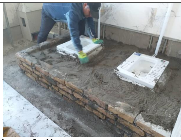
Фото 6: Установка санитарных узлов, март 2024 года