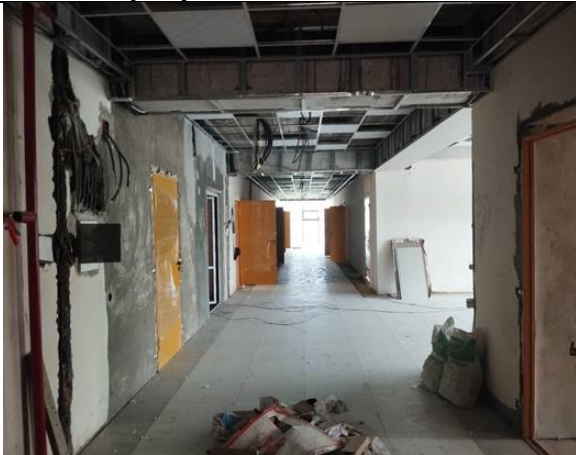
Фото 3: Строительство потолков и установка дверей, март 2024 года